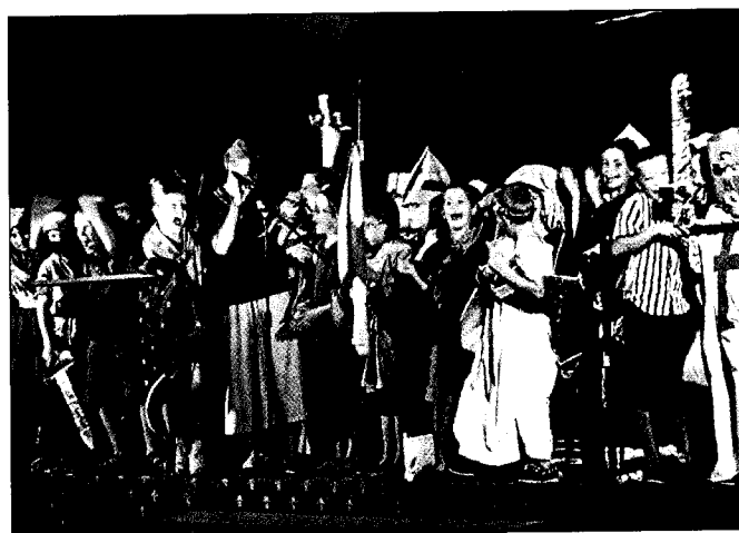
spectacle des plus grands sur l'histoire du Puy

Nous avons fait des tas d'activités dans nos groupes où nous étions répartis par tranches d'âges, et même, nous avons fabriqué un chapelet. Il y avait des gens très gentils qui nous ont aidés, et il y avait des religieux et des religieuses. On nous a raconté de très belles histoires. Pendant ce temps, les grandes personnes ont beaucoup discuté et nos parents