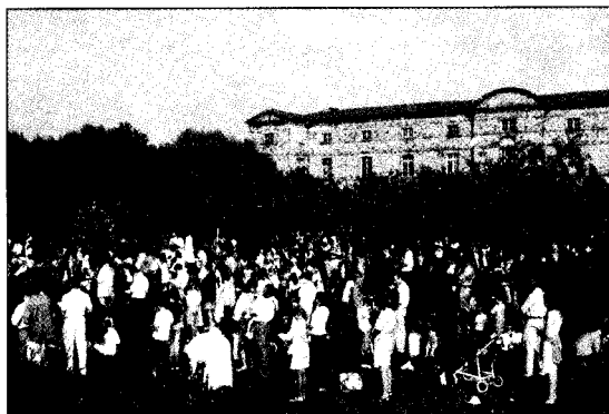
devant la chartreuse, notre lieu de vie...

Vous trouverez dans cette lettre un large écho de cet événement et vous pourrez méditer les trois magnifiques sermons. A l'appel de Jean-Paul II, nos familles deviendront