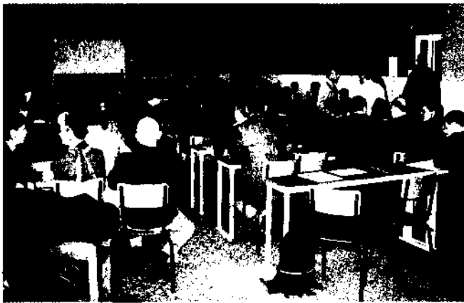
Beaucoup de nouveaux foyers pour ce rassemblement 2005

à un équilibre entre pratique, doctrinal, catéchétique et psychologique, en s'appliquant à répondre aux besoins des 5-6 foyers du groupe.