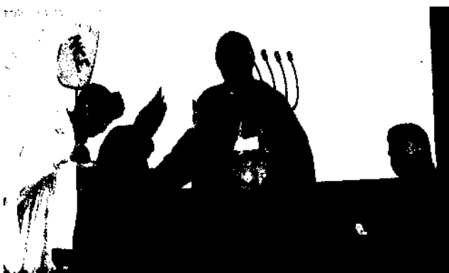
"un moment de vraie distraction chrétienne. On en redemande !!!"