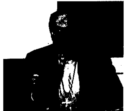
Intervention du Cardinal Barbarin

dont la présence est clef qu'il faut savoir apprécier à sa juste valeur en ces temps de désert spirituel. A cette occasion, Domus Christiani, oeuvre de laïcs, a accueilli plusieurs personnalités religieuses : Le Cardinal Barbarin nous a d'abord rappelé l'importance de la lecture de l'Évangile. Nous avons pu apprécier sa simplicité, son esprit de foi et son désir de voir l'Essentiel. Cependant il nous faut bien avouer notre déception quant à sa malheureuse décision récente perturbant grandement de nombreux catho-